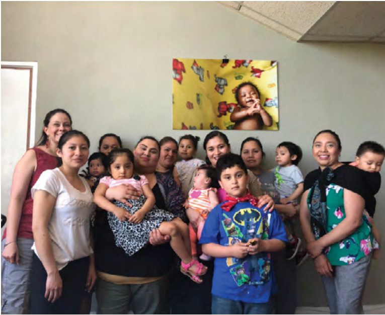
Familias de Open Arms participando en Grupos PEPS y Líderes de Grupo

“Era madre primeriza y estando en un país diferente sin saber cómo funciona el sistema. Me ayuda a salir de casa y socializar con otros es bueno para mi hija.”